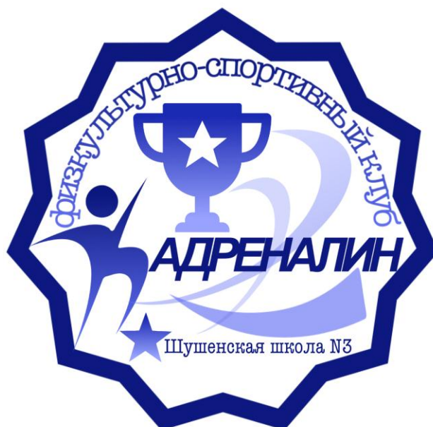
Рисунок 1. Эмблема школьного спортивного клуба «Адреналин»